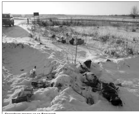
Стихийная свалка на ул.Брянской.

кеты и бутылки ветер разносит по всей округе, увеличивая тем самым территорию свалки и нарушая экологию в близлежащей местности. Летом здесь находят пристанище божьи, которые роются в мусорных кучах в поисках металла, пустых бутылок и картона, потом их слают, зарабатывая тем самым себе на выпитку и закуски. Зимой запахи и мусор свалки скрыты под снегом. А весной и летом жители близлежащих домов закладывают от невинности смрада гниющих отходов.