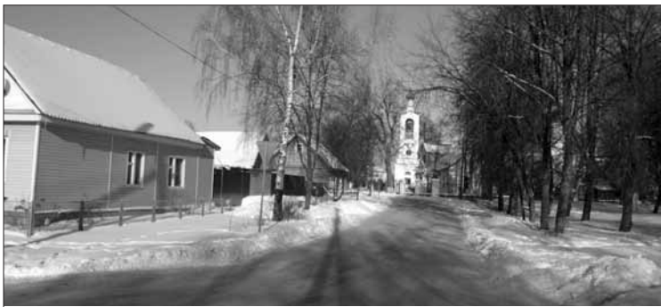
Улицы в г.Жиздере.

Впрочем, и в Жиздере есть застарелая и неразрешенная проблема в сфере благоустройства — утилизация твердых бытовых отходов. На одной из городских окраин расположен полигон ТБО, который больше подходит определение «свалка». Захламленная территория, которая находится в ведении районных властей, уже вплотную подошла к частному сектору города. Бумагу, пластиковые па-