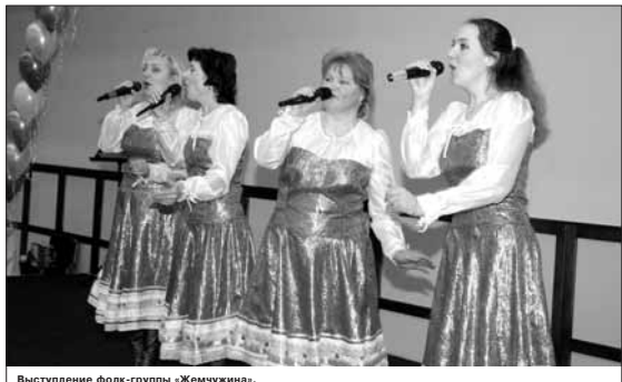
Выступление фольклорной группы «Жемчужина».