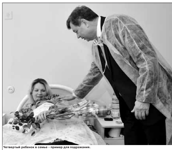
Четвертый ребенок в семье - пример для подражания.