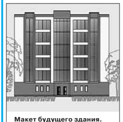
Макет будущего здания.

В указанном месте строительная площадка огорожена забором, установлены флажки и на них вывешены флаги, на ограждении прикреплен паспорт строительства, вырыт котлован, произведена бетонная подготовка. 15 января, в день годовщины создания Следственного комитета России, состоится торжественная церемония закладки первого камня нового здания. Помимо строительства самого здания будет благоустроена прилегающая к нему территория.