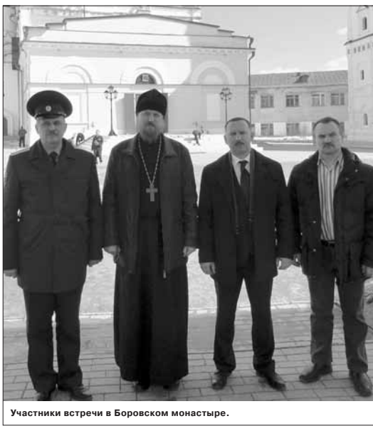
Участники встречи в Боровском монастыре.