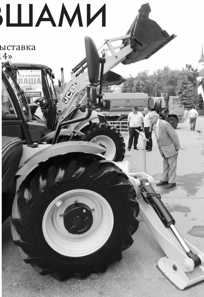
Материалы, посвященные Дню строителя, читайте на 3-й стр.

Приветствуя передовых представителей и ветеранов отрасли, губернатор отметил их весомый вклад в развитие области, подчеркнув, что использование новых технологий и передовых методов работы способствовало выводу строительной индустрии региона на качественно новый уровень. Лучшим работникам строительной отрасли были вручены областные и ведомственные награды.