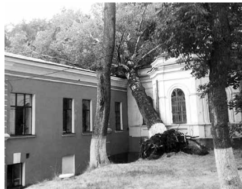
Дерево упало на здание медучилища.