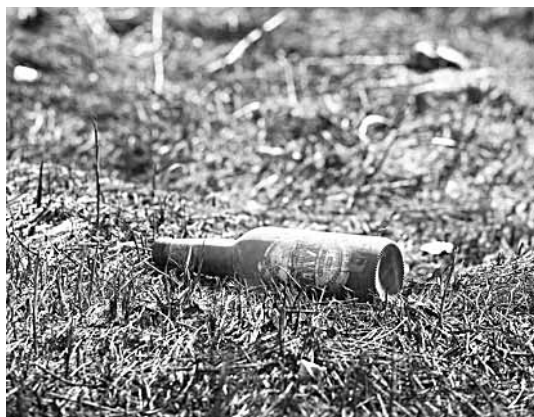
«Следы» пожароопасного отдыха.

пушению возникновения подобных ситуаций в дальнейшем.