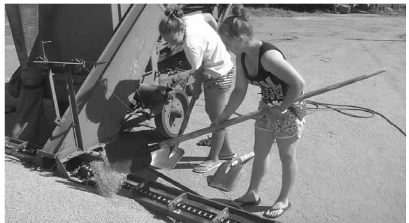
Жерелевские старшекласники на току.