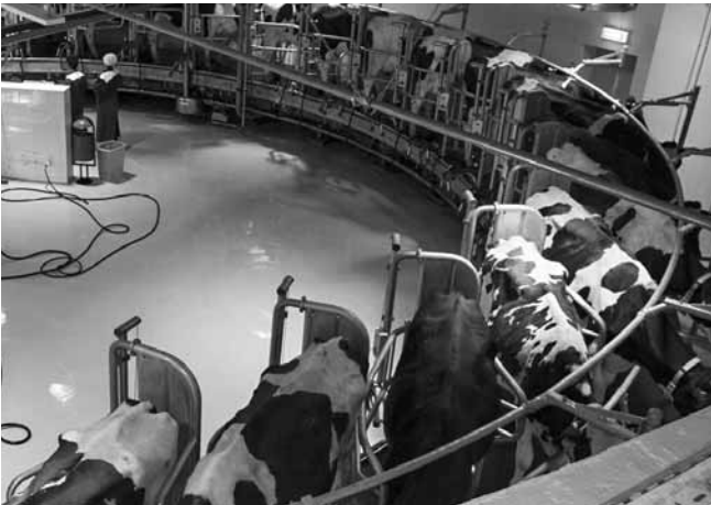
Доение коров на «карусельной» установке фирмы «ГЕА-Фарм-Технолоджи» в СП «Калужское» Перемышльского района.

так как от соблюдения технологических процессов производства молока зависит благополучие большинства сельхозпредприятий, а порой даже их дальнейшее существование.