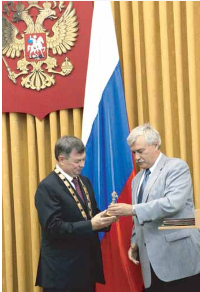
Георгий Полтавченко вручает Анатолию Артамонову символ губернаторской власти - двуглавого орла.

Объем промышленного производства превышает сейчас уровень 1991 года на 46,3%. Наша задача теперь восстановить объем сельскохозяйственного производства. Пока он составляет 70% к 1991 году.