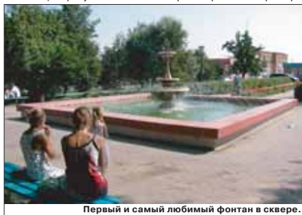
Первый и самый любимый фонтан в сквере.