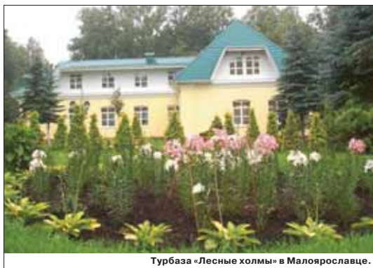
Турбаза «Лесные холмы» в Малоярославце.