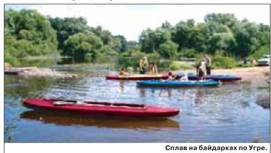
Сплав на байдарках по Угре.