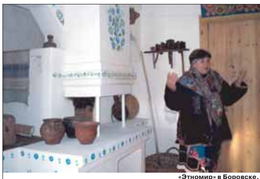
«Этномир» в Боровске.