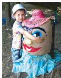
Барабурька, сделанная педагогами и родителями с детьми в детском саду «Радость».

Шедевры дetsадовской архитектуры делаются не только и не столько ради наград (хотя и это важно), сколько ради самих детей, для развития которых одинаково полезен и творческий процесс, и его результат.