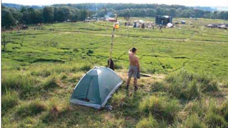
Фестиваль «Пустые холмы» в Мосальском районе.