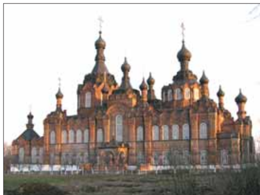
Шамордино в Козельском районе.

Сегодня каждый, кто так или иначе связан с работой в сфере туризма, старается внести свой вклад в пиар-акции, которые помогут познакомить жителей нашего региона и тех, кто живет за его пределами, в пропаганду достопримечательностей Калуж-