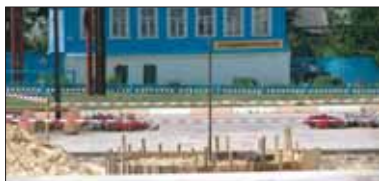
Строительство нового фонтана у Дворца культуры.

Жители Сухиничей очень любят посидеть в центральной скверике, который прекрасно ухожен и благоустроен. Уже с самого утра к фонтанам подтягиваются мамы с колясками и с маленькими детьми, пенсионеры занимают лавочки, чтобы в тени аллеи тихонько вести свои разговоры о жизни. Каждому приятно посидеть в этом красивом месте. Центр Сухиничей с некоторых пор сильно преобразился. Аллеи выложены плиткой, много новых газонов и цветников. А на днях у Дворца культуры заложили новый фонтан. Возможно, в день нашей публикации фонтан уже будет работать. Но когда мы неделю назад были в Сухиничах, фонтан только начинали делать. Рабочие привезли строительный материал, и жители райцентра были в предвкушении. Благоустройство любят все.