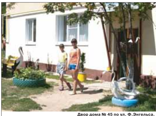
Двор дома № 45 по ул. Ф. Энгельса.

Нам удалось побывать на территории детского сада №2 «Радость». Это не просто место отдыха детей, но и зона их развития и коллективного творчества. Рядом со зданием дetsада растёт целый лес сказочных скульптур.