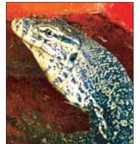
Бенгальский варан Сильва.

— Я полтора года пытался общаться с городскими властями по вопросу создания зоопарка. Пока не находим консенсуса. Разные у нас представления о зоопарке. Город хочет видеть прибыльное предприятие, и чтобы предприниматель сам создал его с нуля, — объясняет он. — Я общался со специалистами из Смоленского зоопарка, Тульского зооэкзотариума. Без господдержки поднять такое дело нереально. В моем понятии зоопарк — это не зооферма, где те же рептилии находятся в небольших террариумах. Там должен быть воссоздан уголок среды обитания, чтобы посетители могли видеть, тропическое это животное или пустынное. Должно вестись разведение животных. Дети и взрослые приходили бы сюда на экскурсии. Студенты и