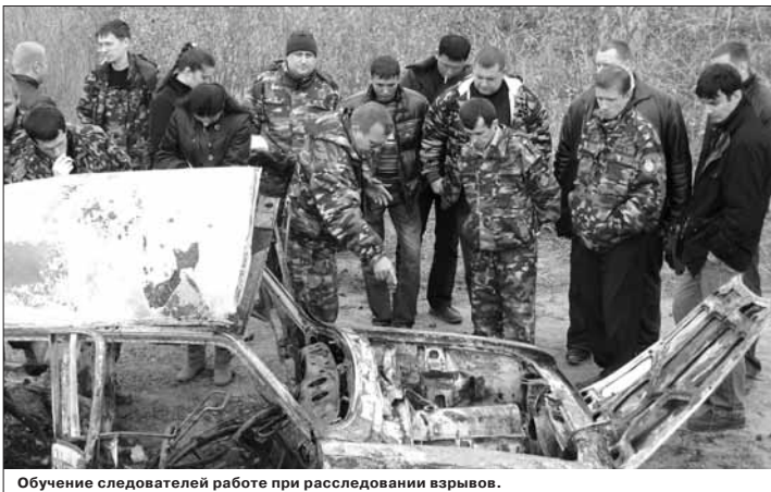
Обучение следователей работе при расследовании взрывов.

Эффективность принятых мер по выявлению коррупционных преступлений будет обсуждена на очередном совещании по итогам работы за полугодие.