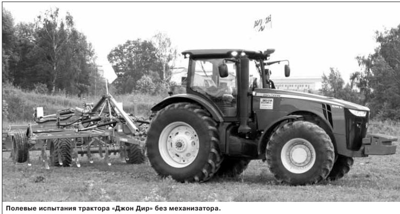
Полевые испытания трактора «Джон Дир» без механизатора.

Вместе с мини-презентациями выступили руководители компаний, организовавших эту акцию. Они представили продукцию, которая собирается и проходит сервисный осмотр в агротехнологическом центре «Детчина». Компания «Лемкен» к услугам аграриев предлагает сегодня 12 наименований инновационных агрегатов (плуги, бороны, культиваторы, сеялки, опрыскиватели и т.д.). Ведущий производитель сельхозтехники для возделывания картофеля и овощей компания «Гримме» представила как прицепные, так и самоходные картофеле- и свеклоуборочные комбайны, комплексы для посадки, ухода, уборки и закладки картофеля и овощей на хранение. Компания «Биг Дачмен» продемонстрировала инновационное оборудование для свиноферм и птицеводческих комплексов. Эти три компании уже успешно производят и комплектуют сельскохозяйственную технику и оборудо-