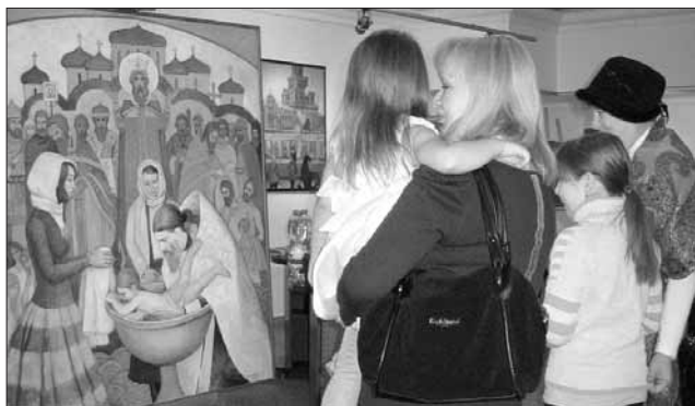
Особое внимание зрителей привлекла картина «Крещение».