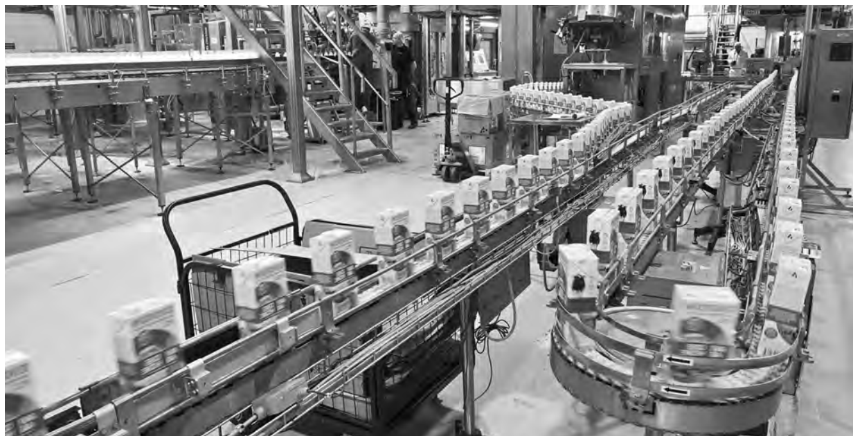
На АО «МосМедынагропром».

– Наша первоочередная задача – и местной, и региональной власти, и каждого из нас - не оставлять без внимания бойцов и их близких. Это очень важно, - подчеркнул глава региона.