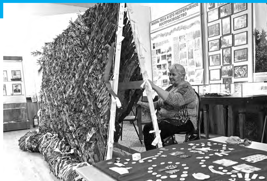
Жиздринский музей предоставляет свои площади для волонтеров, которые плетут маскировочные сети для СВО.

проблем. В частности, уже завершены проектные работы и получено положительное заключение Главгосэкспертизы на строительство очистных сооружений в райцентре, что повышает шансы получить федеральное финансирование и реализовать проект.