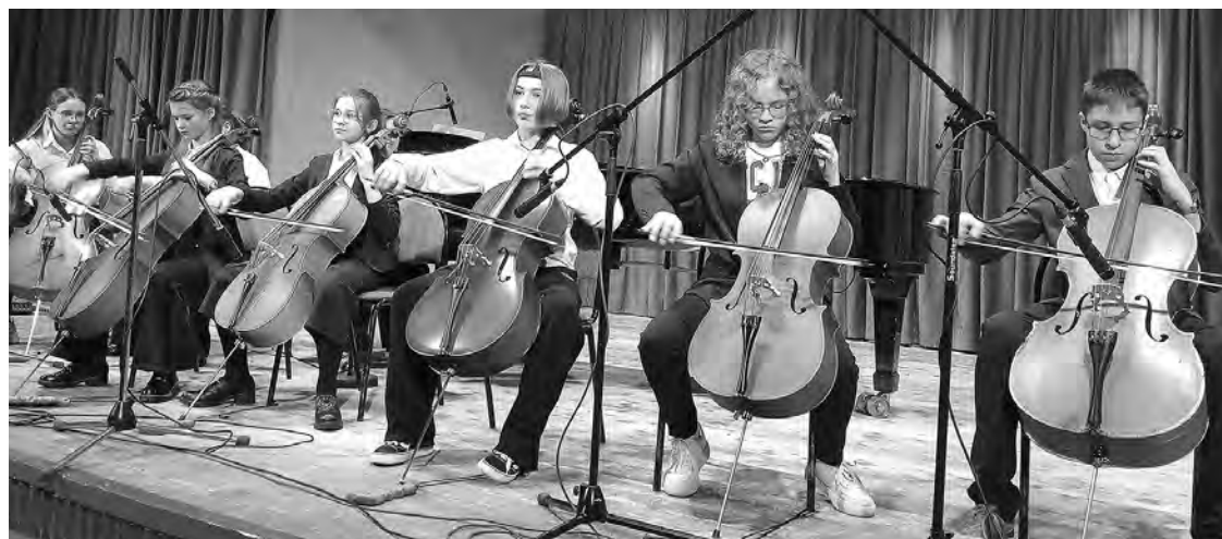
Ансамбль виолончелистов детской школы искусств № 1 имени Н.П. Ракова.

Главная цель творческого мероприятия – популяризация инструментальной музыки и ее традиций, выявление и поддержка талантливых исполнителей и коллективов. Проект запустила детская школа искусств № 1 имени Н.П. Ракова.