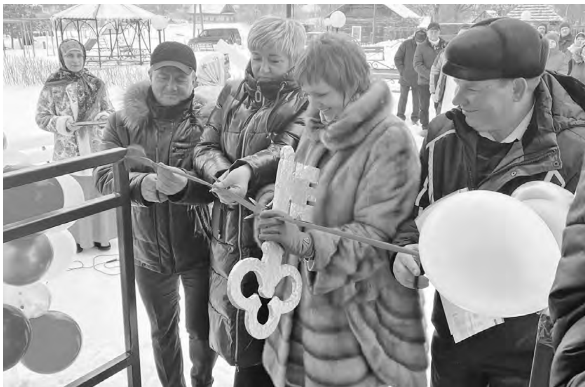
Открытие ФАПа в д. Гавриловка Кировского района.

15 февраля открылся долгожданный ФАП в деревне Гавриловка Кировского района. Кабинеты приема взрослых и детей, акушерский и процедурный кабинеты, санузел, приспособленный для маломобильных граждан, санитарные помещения. Теперь жители