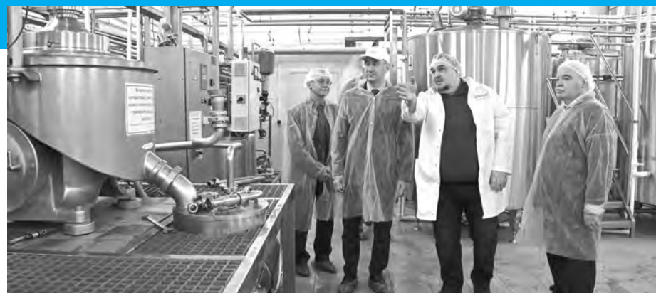
В ООО «Трастед продакт».

отметил, что по итогам работы за год район уже третий раз подряд занял первое место в своей группе по наилучшим показателям социально-экономического развития. Устойчиво развивается ключевая отрасль муниципалитета – сельское хозяйство. Открываются новые предприятия и крестьянско-фермерские хозяйства.