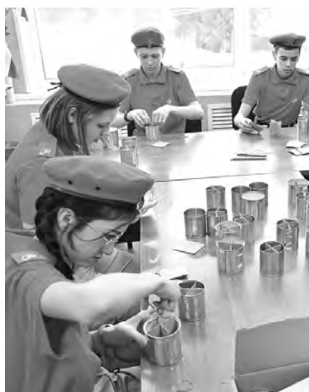
Глава региона встретился с педагогами и детьми Износковской школы, поблагодарил учителей и школьников за поддержку бойцов СВО.

На производственной площадке ООО «Трастед продакт» губернатор познакомился с технологией производства йогуртов. В настоящее время завод занимает второе место среди