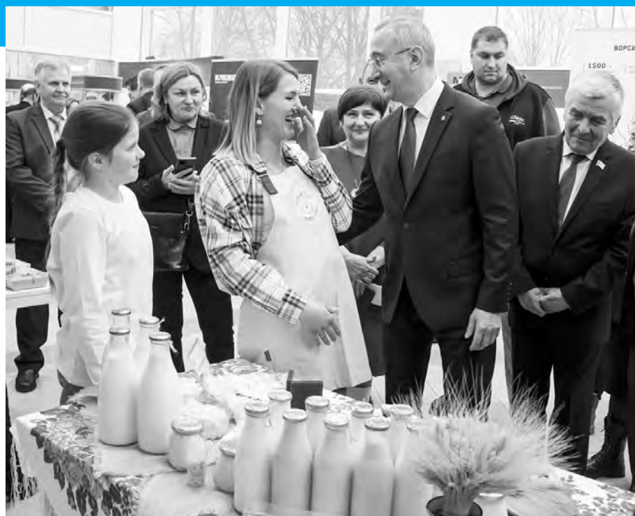
Глава региона посетил выставку продукции, которую производят в муниципалитете.

В отчете глава администрации района также отметил, что в муниципалитете реализуются три национальных проекта, пять региональных и 27