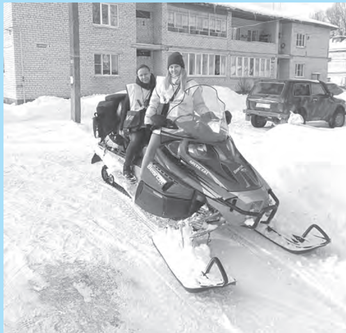
Доедем до каждого избирателя. Боровский район.

По итогам первой недели мы подготовили небольшой фоторепортаж о работе обходчиков