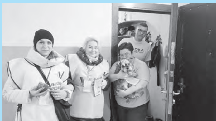
Нас согревает теплое отношение земляков. Обнинск.