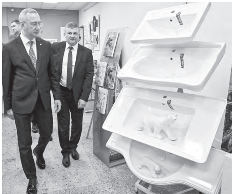
На предприятии «Кировская керамика».

По оценке губернатора, Кировский район достиг значительных показателей не только в промышленном производстве, но и в аграрной сфере.