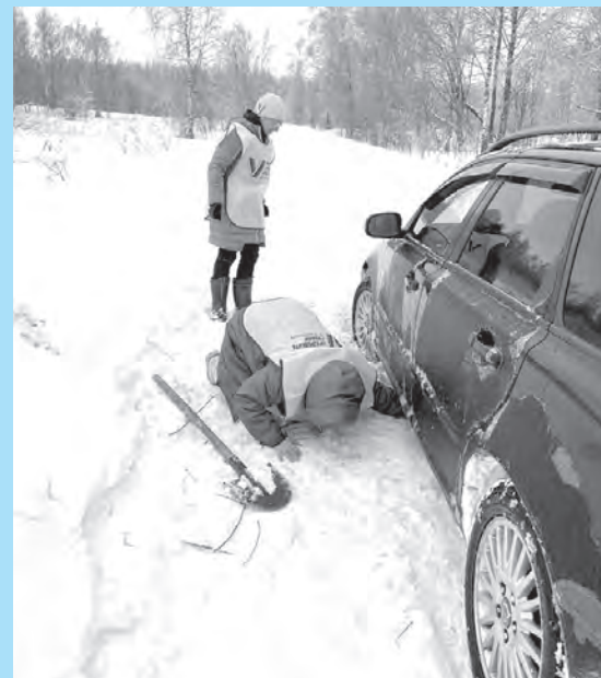
Обходчикам приходится нелегко. Спас-Деменский район.

ВАЖНО Адресное информирование избирателей продлится С 17 ФЕВРАЛЯ ПО 7 МАРТА.