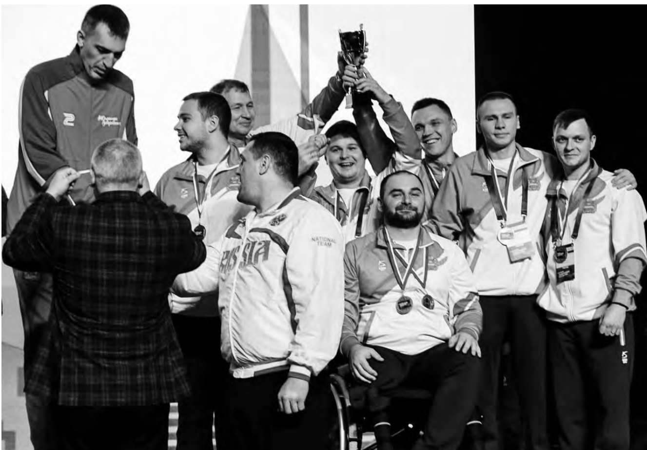
Серебряный кубок у нашей команды по волейболу сидя.