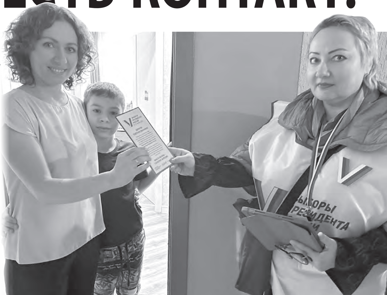
Наши избиратели – самые лучшие. Калуга.

- Во всех недружественных странах уже готовы релизы о том, что наши выборы нелегитимны, непрозрачны, признавать их нельзя ни в коем случае. 25 делегатов в Европарламенте уже заявили, что намерены сделать такие заявления. Но председатель Центризбиркома Элла Памфилова сказала, что нас совсем не интересует мнение недружественных стран. Нас интересует мнение населения России, как оно к этому отнесется. Поэтому чем больше людей используют свое избирательное право, тем для нас лучше. И доказывать никому ничего не надо будет, - выразил свое мнение сенатор.