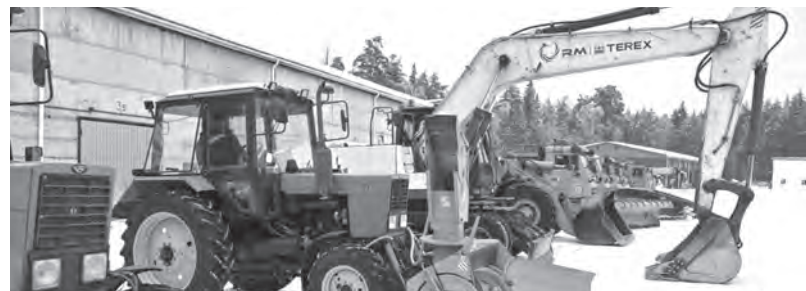
На предприятии «Кировский дорожник».

- Буквально перед нашей встречей к нам обратились с предложением открыть отделение гемодиализа. Мы договорились, что вместе с районом, с меценатами кировскими и при участии региона сделаем его, думаю, в течение полугода, - заверил Владислав ШАПША .