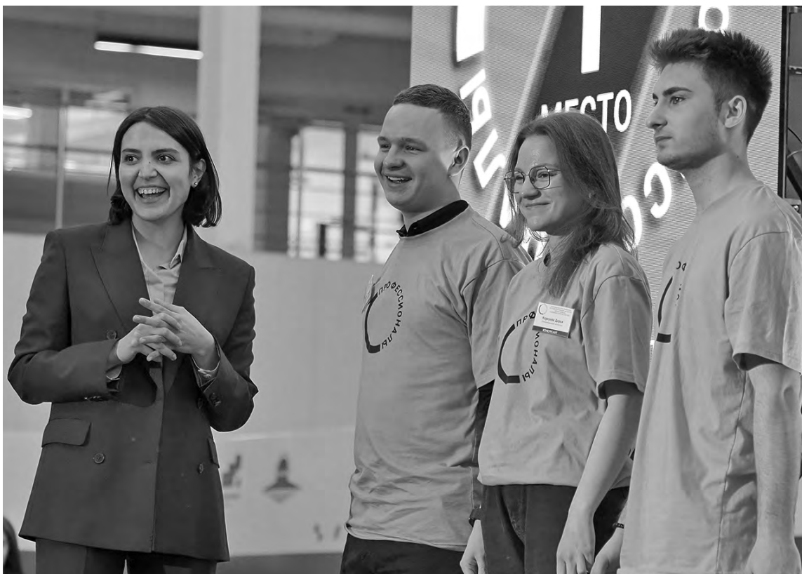
Победители регионального этапа чемпионата «Профессионалы».

В этот же день в Федеральном технопарке прошла передача эстафеты флага Всероссийского конкур-