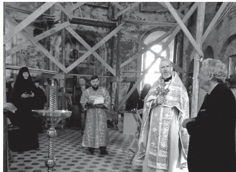
Члены группы внесли свой вклад в восстановление храма в селе Мошонки Мещовского района.