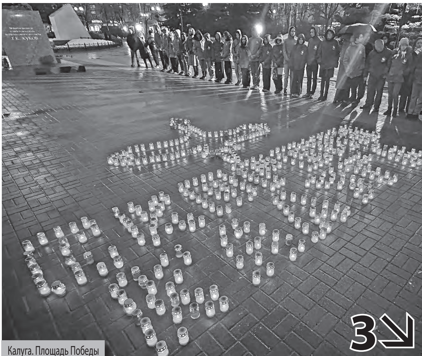
Калуга. Площадь Победы