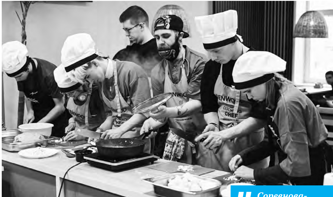
В Калуге прошла своя «Битва шефов»

М ногие с интересом смотрят кулинарную программу на НТВ, где две команды соревнуются в умении приготовить что-то эдакое по заданию шефов. В нашем областном центре на прошлой неделе стартовала серия кулинарных поединков, в которых будут соревноваться команды детей из социальных учреждений с одной стороны и калужских предприятий и организаций – с другой.