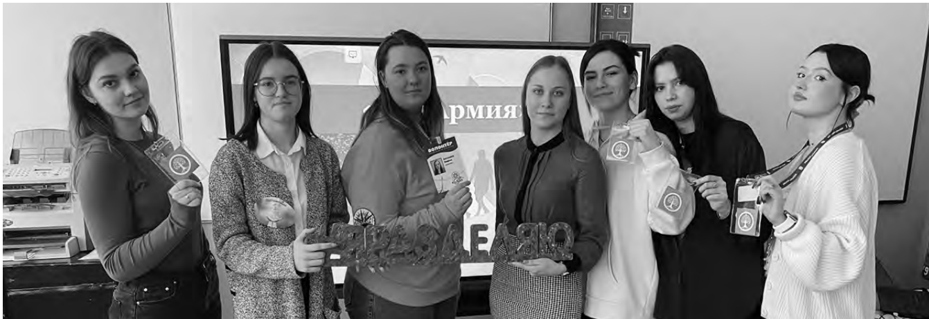
Победители стартапа – команда «ЭКО-защитники», Бутчинская школа Куйбышевского района.