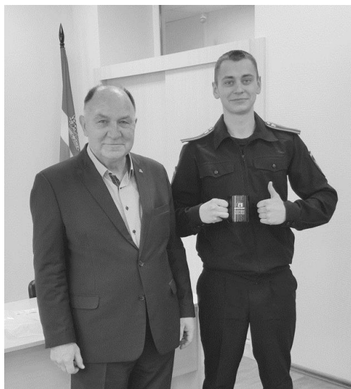
10.12.2024. г. Калуга. Встреча Уполномоченного со студентами Калужского института (филиала) ВГУЮ (РПА Минюста России) в рамках Всероссийского единого урока по правам человека. Отличившимся – сувениры от омбудсмана!