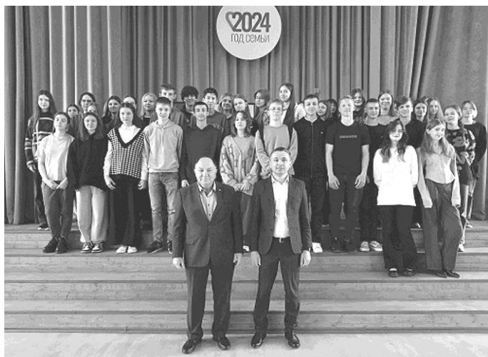
13.05.2024. г. Калуга. Школьникам – о правах человека: встреча Уполномоченного с учащимися СОШ № 5 г. Калуги