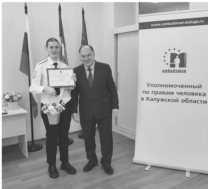
29.02.2024. г. Калуга. Награждение финалистов XVI-го областного конкурса научных работ студентов «Права человека и будущее России»