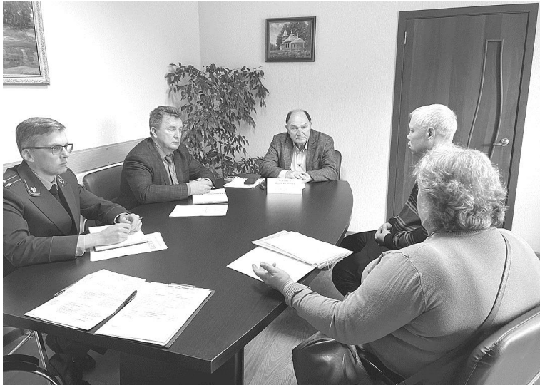
15.10.2024. с. Ульяново Калужской области. Личный прием Уполномоченного в с. Ульяново