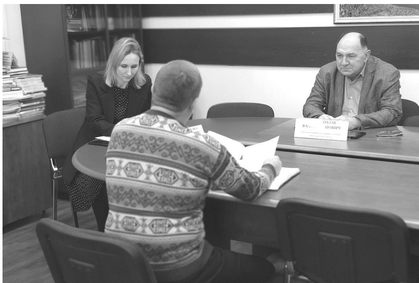
12.02.2024. г. Калуга. На личном приеме Уполномоченного