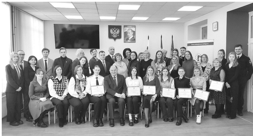
29.02.2024. г. Калуга. Участники и члены жюри XVI-го областного конкурса научных работ студентов «Права человека и будущее России»