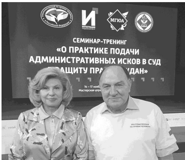
17.11.2024. г. Солнечногорск, Московская область. С федеральной коллегой – Татьяной Москальковой в мастерской управления «Сенеж»