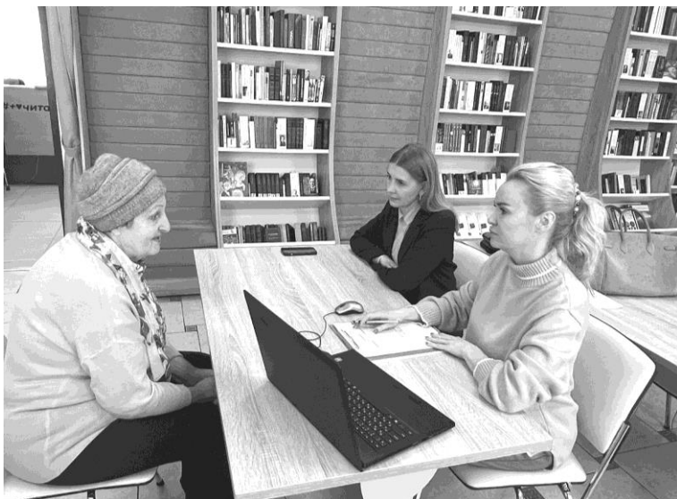
29.02.2024. пос. Ферзиково, Калужская область. На прием к юристу – в библиотеку